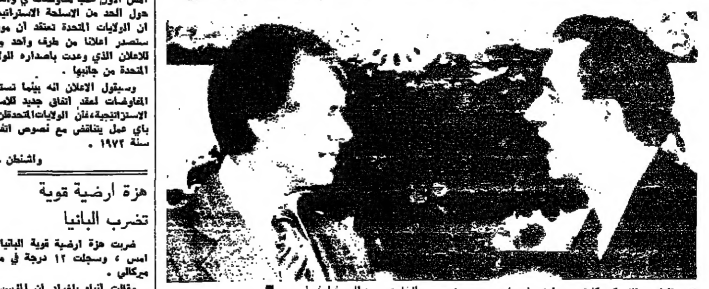
الرئيس الأميركي كارتر لدى اجبائه مع وزير الخارجية السويدي امس